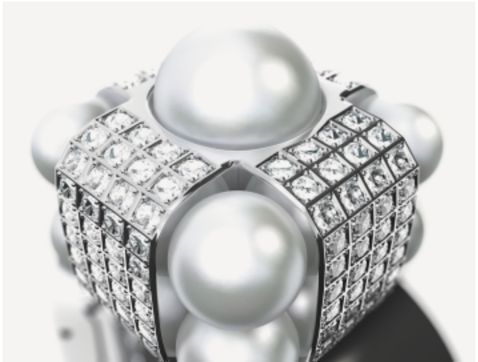
Beispiel einer fotorealistischen Computer-Visualisierung

Mit dem Einsatz von CAD/CAM machen wir uns von einigen dieser Fesseln frei. Nicht zu-